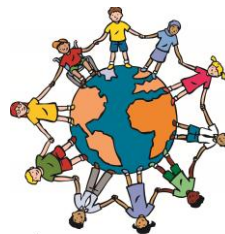
We zijn allemaal anders